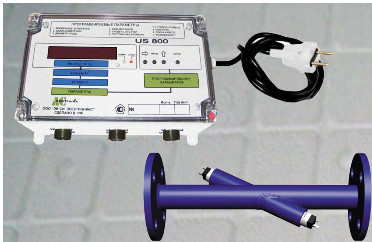
Рисунок 1 - Общий вид расходомера-счетчика жидкости ультразвукового US800 и УПР

Конструктивно ЭБ представляет собой герметичный пластиковый приборный корпус для настенного монтажа.