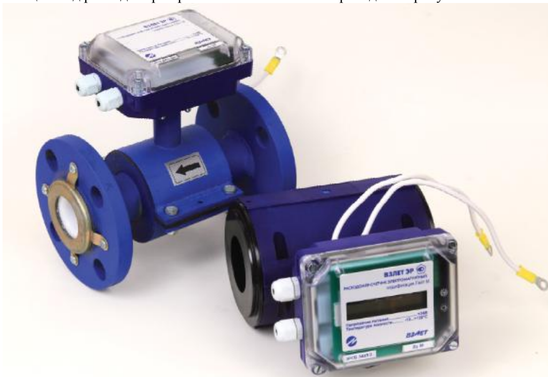
Рисунок 1 - Общий вид расходомеров-счетчиков электромагнитных «ВЗЛЕТ ЭР» модификация «Лайт М»

Общий вид расходомеров различных исполнений приведен на рисунке 1.