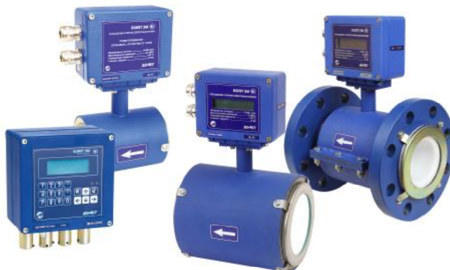
Рисунок 1 - Общий вид расходомеров-счетчиков электромагнитных «ВЗЛЕТ ЭМ» различных исполнений

Для защиты от несанкционированного доступа вторичный измерительный преобразователь расходомера должен быть опломбирован в соответствии с рисунком 2.